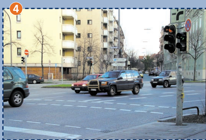
Kreuzung Hansastrasse/Am Westpark/Fuggerstraße